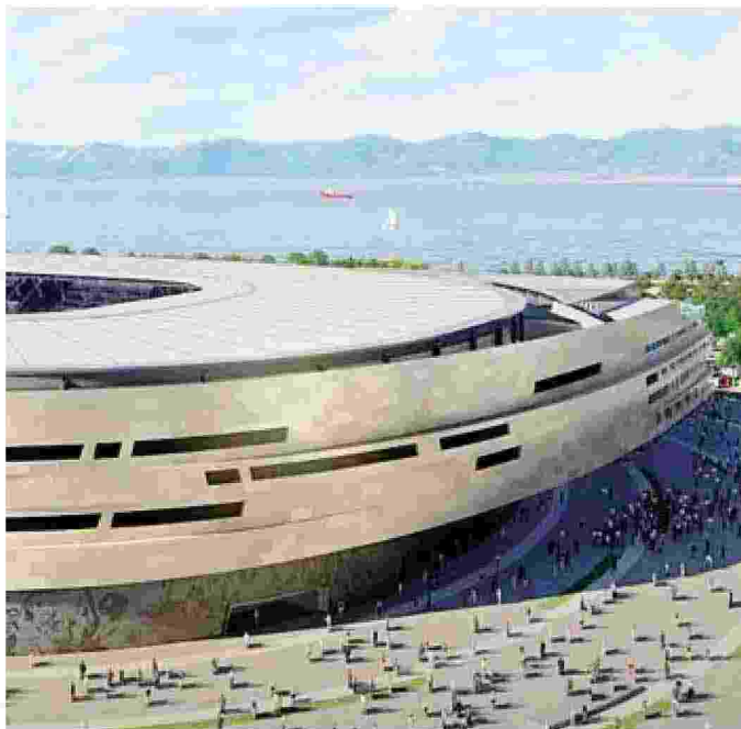
Nel rendering porzione del futuro stadio di Cagliari made in Bergamo