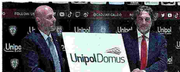
Nel futuro Sopra la Sardegna Arena, l'attuale casa del Cagliari calcio sotto il presidente rossoblù Tommaso Giulini con l'ad di Unipol Carlo Cimbri

su cui non abbiamo interessi di natura immobiliare ma ci piacerebbe che fosse la casa dello sport in Sardegna, non solo del calcio ma di altri eventi».